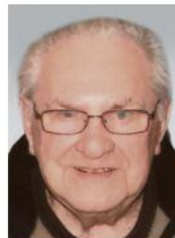
Agrandir la photo