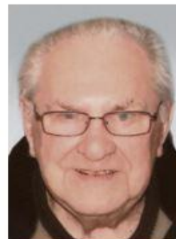
Agrandir la photo