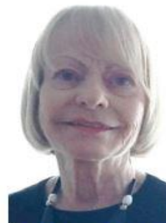
Agrandir la photo