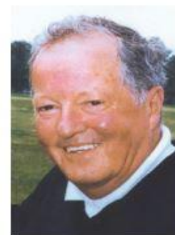
Agrandir la photo