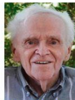
Agrandir la photo