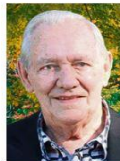
Agrandir la photo